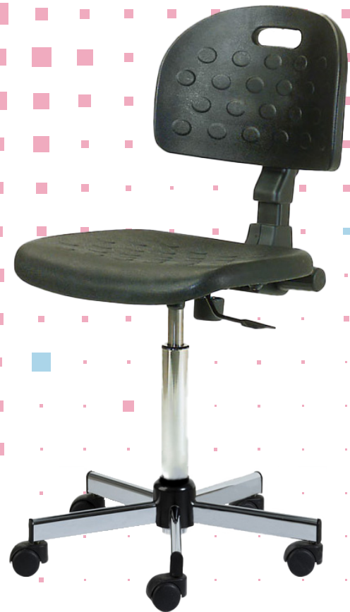
Photo du modèle avec pied chromé au lieu de pied aluminium